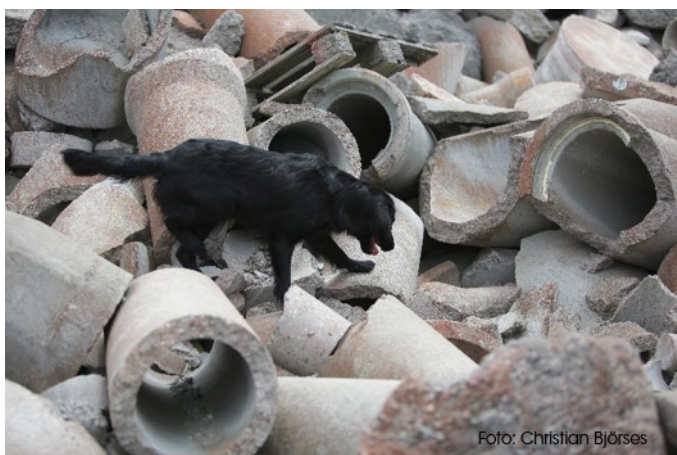
Figur 2 Hunden ska kunna söka över olika underlag.

En hund som ska certifieras som tjänstehund får inte vara äldre än 5 år. Det betyder att utbildningen måste påbörjas i god tid, så en lagom ålder vid kursstart är 1-3 år för hunden. Likaså ställs krav på att hunden har godkänd status på höfter och armbågar.