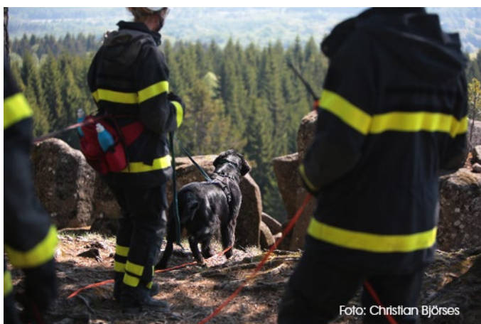
Figur 4 Ni ska som ekipage kunna jobba tillsammans med andra i räddningstjänsten.

Som färdigt ekipage kommer ni ingå i NUSAR-styrkan, som är MSB:s nationella räddningsstyrka. Du kommer då att skriva avtal med MSB.