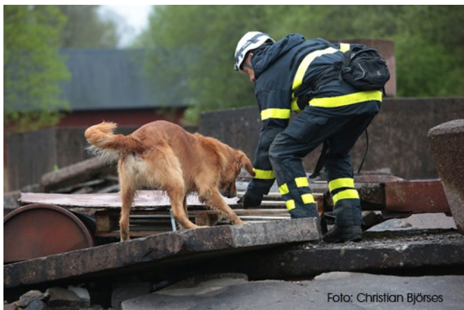
Figur 1 Hunden ska kunna söka självständigt och tillsammans med dig.

Utbildningen ställer en mängd krav på hunden och på dig som hundförare.